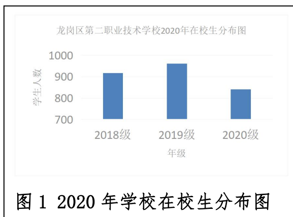
图 1 2020 年学校在校生分布图