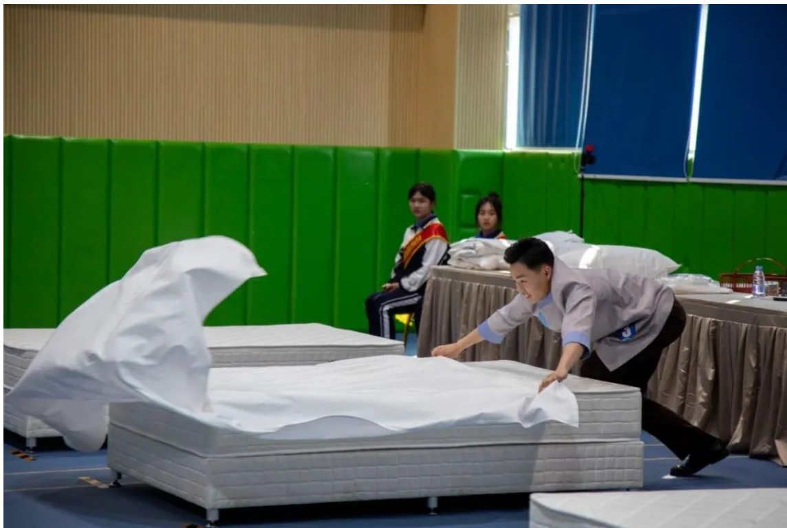
“酒店服务”赛项现场，各参赛队选手激烈角逐

此次酒店服务赛项，参赛选手需要在规定时间内完成前厅服务、客房服务和餐饮服务三个分赛项的比拼。其中，前厅服务赛项包括前厅接待服务和专业理论与英语问答；客房服务赛项包括客房中式铺床与开夜床、仪容仪表展示；餐饮服务赛项包括工作台准备、中餐宴会摆台、席间服务、仪容仪表展示、专业理论与英语问答等。实操项目（中餐宴会摆台、客房中式铺床），对于尺寸的把握要求非常严格，不能出现超过1厘米的偏差，不能出现中线偏移。我校参赛选手们在赛场表现出娴熟的技能、良好的素养和奋发的精神，充分展现出龙岗二职学子积极向上的精神风貌。